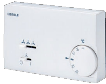
KLR-E 525 56