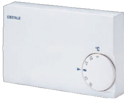
KLR-E 525 55